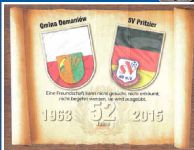
Wandtafel, die an die polnischen Sportler übergeben wurde