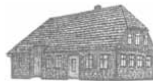
Büdnererei in Picher