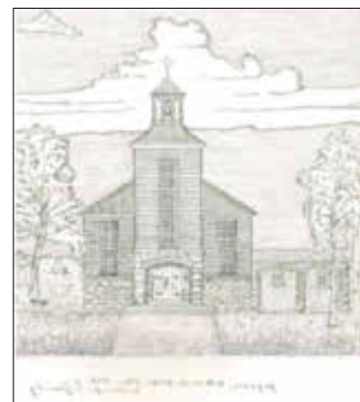
Hagenow, Katholische Kirche, Plan 1948, Zeichnung: S. Spantig

„Am 7. und 8. Mai fand auf dem Grundstück neben dem Kreis-krankenhaus die Beerdigung von 144 Leichen der im Konzentrationslager bei Wöbbelin deutscherseits umgebrachten Personen statt. Die Arbeiten mußten durch hiesige Mitglieder der NSDAP verrichtet werden, welche auch die erforderlichen Leichentücher liefern mußten, um den Opfern des Verbrechens noch ein würdiges Begräbnis zu verschaffen und die Schuld der Partei öffentlich zu brandmarken.“