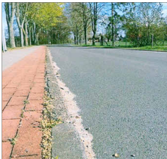
Alle Einwohner halten sich strikt an die Kontakt- und Ausgangssperre ...